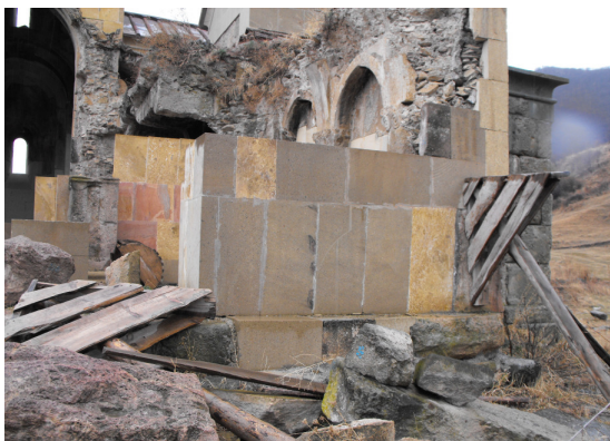
Նկար 1 (Հնեվանք)