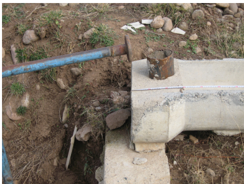
Նկար 1 (Վարդենուտ)